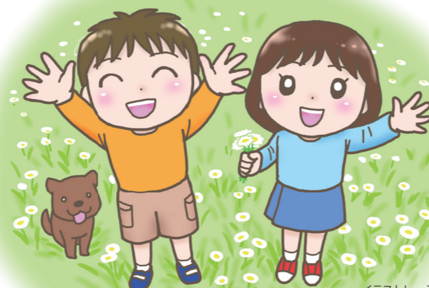
イラストレーション：野波ツナ

2次元バーコードが読み取りにくい時は▶▶▶ 読み取りたいコードの上下のコードを指などで隠していただくと、必要なコードが読み取れます。