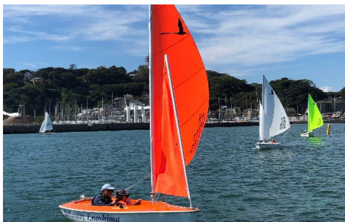
セーリング体験会の様子