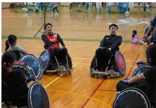
車いすラグビー体験会