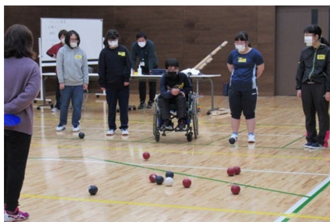
障がい者スポーツ教室(ボッチャ)