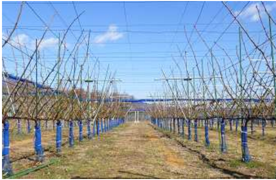
図1 ジョイントV字トレリス樹形