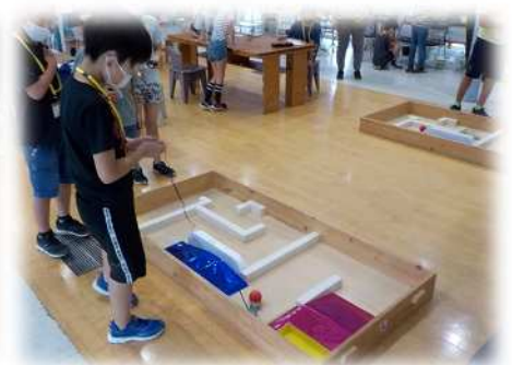
写真(左)：6月20日(日) 座間市立青少年センター 参加者：9名