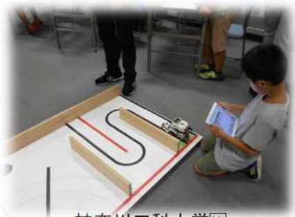
神奈川工科大学 協