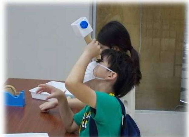
6月26日(土) はまぎん子ども宇宙科学館協 参加者：10名