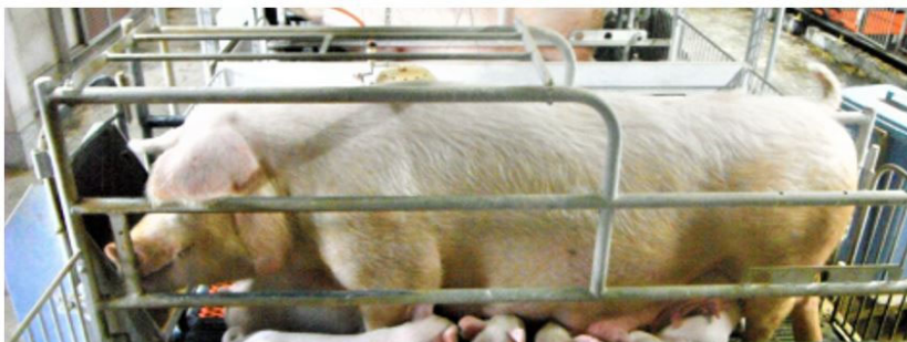
図2 5産のTopigs20 (体長162cm、ストール長辺190cm)