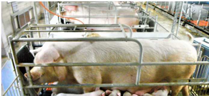
図1 5産のTopigs20 (体長162cm、ストールの長辺190cm)