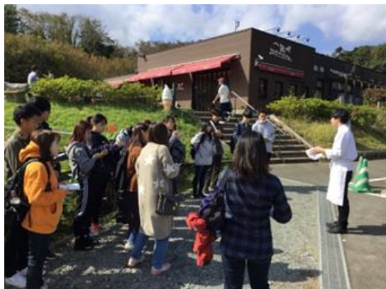
<一夜城ヨロイツカファーム>

大学生が地域課題の分析、解決に向けた提案を検討するにあたり、小田原市の歴史や地勢、産業などの地域特性を理解していることが必要であるため、10月にみかん農園と一夜城ヨロイツカファーム(マルシェを併設するレストラン)、小田原宿なりわい交流館、小田原城址公園等の調査を実施した。