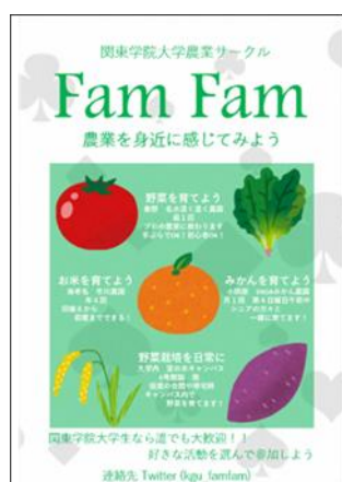
<農園サークル募集チラシ（制作：関東学院大学二宮ゼミ2年生・農業サークルチーム）>