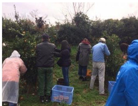
＜フィールドワークの様子＞