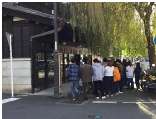
<小田原宿なりわい交流館>