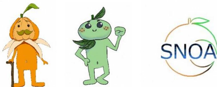
<イメージキャラクター・ロゴ（制作：関東学院大学二宮ゼミ2年生・キャラクターデザインチーム）>

SNOAの活動を広報するツールとして、イメージキャラクター・ロゴのデザインが提案された。今後、広報媒体や商品パッケージ等に活用することで、活動に親しみやすさを持たせ、効果的な宣伝に役立つことが期待できる。