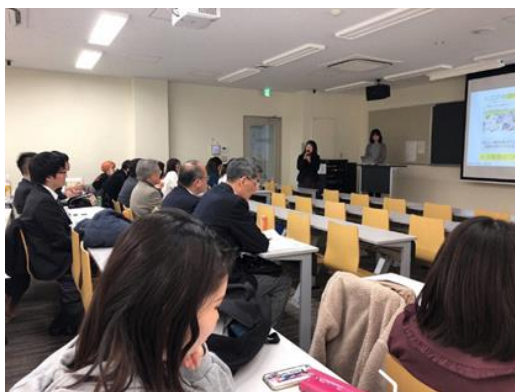
<最終報告会の様子>

12月に中間報告会を開催し、大学生がフィールドワークを通して検討した分析結果や改善提案についての中間報告を行った。また、提案内容について大学生とSNOAと意見交換を行い、提案の実現に向けて具体的な実施方法を検討した。そして、1月に最終報告会を開催し、農業サークルの立ち上げなど8つの改善提案を大学生が県、小田原市、SNOAに行った。