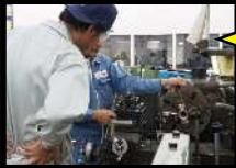
普通旋盤 実習風景