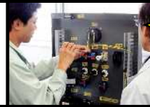
工場 電気設備 実習風景