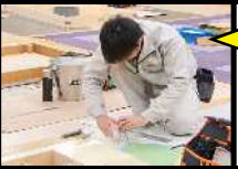
内装床 仕上げ 実習風景