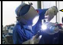
ティグ溶接 実習風景