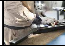
構造物 鉄工 実習風景