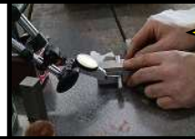
機械組立 仕上げ 実習風景