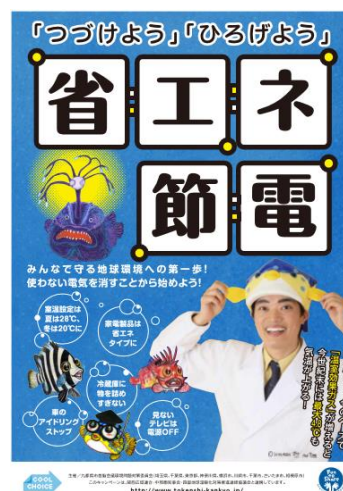
「ライフスタイルの実践・行動」 キャンペーンポスター

こうした様々な取組によって、県民の間で地球温暖化対策及び節電の必要性についての認識は着実に広まっていますが、日常生活において具体的な実践行動に結びつけていくためには、今後も、身近なところから一人ひとりが実践していくことを促す普及啓発を続けていく必要があります。