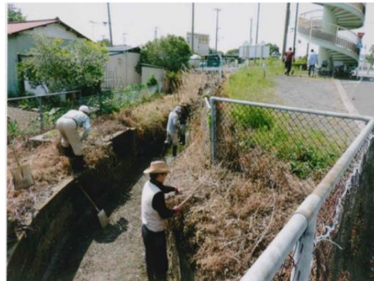
用水路の草刈り等による維持補修活動 (多面的機能支払事業 平塚市 城所地区)