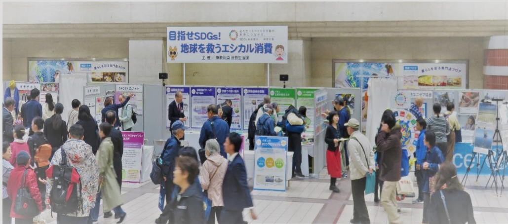
「目指せ SDGs ! 地球を救うエシカル消費」イベント(平成 29 年度開催)

* 「消費者市民社会」：消費者教育推進法では「消費者が、公正かつ持続可能な社会の形成に積極的に参画する社会」と定義されています。