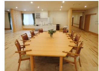
県産木材施設(老人福祉施設聖アンナの家)