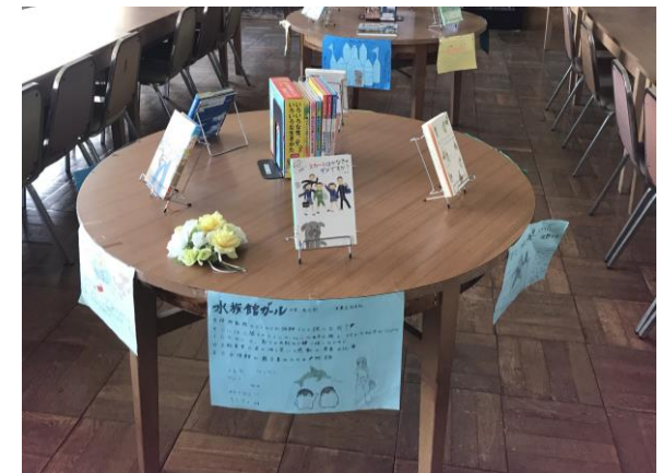
【湘光中学校 図書室】