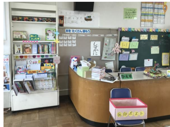
【上大井小学校 図書室】