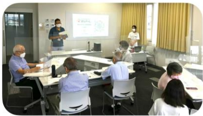
5人1組のチームに参加