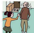
目を離せない家族の見守りや声かけなどの気づかいをしている