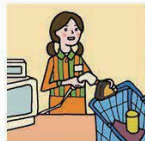
家計を支えるために労働をして、障がいや病気のある家族を助けている