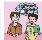
日本語が第一言語でない家族や障がいのある家族のために通訳をしている