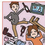
アルコール・薬物依存やひきこもりなどの家族をケアしている