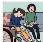
障がいや病気のあるきょうだいの世話や見守りをしている