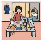
アルコール・薬物・ギャンブル問題を抱える家族に対応している