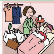
仕事と介護でせいじっぱいでほかに何もできない