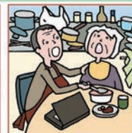
仕事を辞めてひとりで親の介護をしている