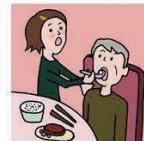
障がいや病気のある家族の身の回りの世話をしている