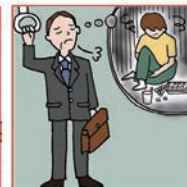
障害や病気の家族の世話や介護をいつも気にかけている

©一般社団法人日本ケアラー連盟 / Illustration: Izumi Shiga