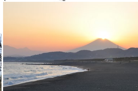
夕暮れの平塚海岸