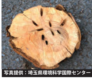
幼虫に食害された樹木の内部

公園や街路樹などのサクラ が加害されると 景観が悪化 し たり、 お花見を楽しむことが できなくな ってしまいます。