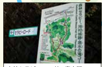
森林セラピーロードの案内版

山北町健康福祉センター さくらの湯 山北駅に隣接する便利な場所にある入浴施設。炭酸カルシウムが湯にとけ込んでいます。打たせ湯・圧注浴・サウナなどもあり、美肌づくりやリフレッシュなどに。 【住】足柄上郡山北町山北1971-2 【電】0465-75-0819 【営】11:00～21:00 【入】一般(高校生以上)500円(2時間)、子ども・障がい者200円(2時間) ※2時間以上滞在する場合は、1時間あたり一般(高校生以上)100円、子ども・障がい者50円 【休】木ほか 【HP】 http://www.town.yamakita.kanagawa.jp