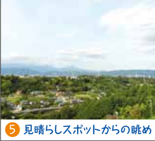
5 見晴らしスポットからの眺め