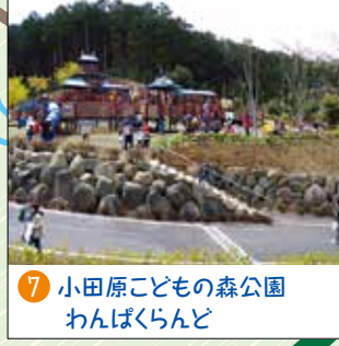
7 小田原こどもの森公園 わんぱくらんど