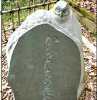
10 からたちの花の小径