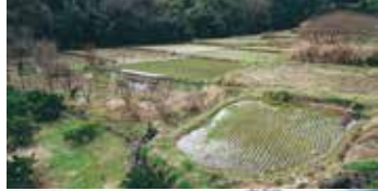
美しい棚田「欠ノ上田んぼ」