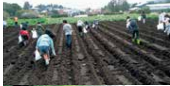
じゃがいも植え付け、久野小「学校農園」