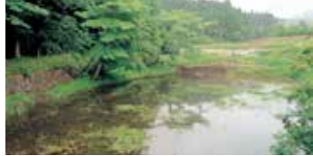
「舟原ため池」1658～60年に灌漑用として築造