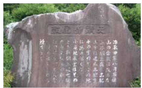
青年会が設置した小道地蔵寺屋敷跡の碑