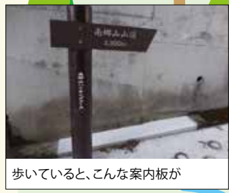
歩いていると、こんな案内板が

いい景色の中で楽しくパークゴルフ! 湯河原町総合運動公園 パークゴルフ場 緑豊かな丘陵地にあり、全面に相模灘や伊豆半島を望む、優れた景観の中でプレーを楽しむことができるパークゴルフ場です。 【住】足柄下郡湯河原町吉浜1987 【電】0465-63-7288 【営】9:00～(閉場時間は営業月により変更) 【入】大人200円/回 子供100円/回 【休】毎週木(木が祝日の場合はその前日)、年末年始 【HP】 https://www.town.yugawara.kanagawa.jp/soshiki/5/1416.html