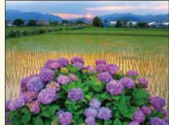
あじさいの里 広大な田畑を基盤の目のように区切る農道や水路に沿って5千株ものあじさいが植えられています。遠くに見える富士山と咲き誇るあじさいのコントラストは見事。