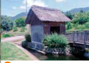
4 山王供養水辺公園 公園内には用水路の豊富な水を利用した小川があり、休憩者に心の安らぎと潤いを与えてくれます。