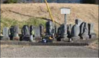
6 馬頭観音石碑群 馬の保護神として特に江戸時代に広く信仰され、毎年7月17日には金井島地区の念仏講で供養が行われます。