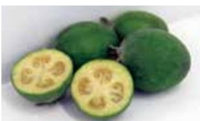
【詳しく知りたい方は】 「大井スイーツ」で検索 (大井町HP)

「フェイジョア」は、南米原産で見た目は梅、味と香りはパイナップルに似ているフルーツ。地元ではかつてみかんに次ぐ生産量を期待されましたが、思うように人気が出ませんでした。そんなフェイジョアに目を付けたのが、町内のシェフや菓子職人。フェイジョアを使ったケーキやまんじゅうなどを次々に開発すると大好評に。新しいご当地スイーツを、ぜひ味わって。