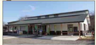
1 農業体験施設 四季の里

2月下旬～3月中旬が見ごろ。3月初旬ごろには、毎年「四季の里 里山花まつり」が開催され、にぎわいます。