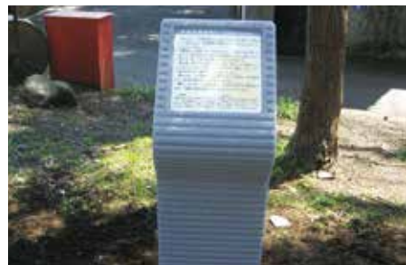
中井の昔話案内板

心地よい里山風景の残る中井町には様々な昔話が言い伝えられています。ルート上の実際の伝承地付近に案内板が設置されています。探してみよう。