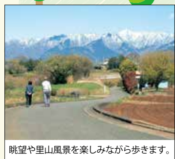
眺望や里山風景を楽しみながら歩きます。

5 蓑笠神社 この神社の縁起は、スサノオノミコトが雨降山(大山)へ行く際に蓑笠を忘れていった説や、昔この地で行われていた農具市で蓑笠が多かった説などがあります。