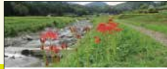
野生の彼岸花 彼岸の季節、9月中旬～下旬頃に野生の彼岸花の群生が見られます。川に沿って、列をなす燃えるような赤い花は見事な景観。そっと眺めよう。