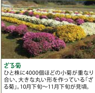
ざる菊 ひと株に4000個ほどの小菊が重なり合い、大きな丸い形を作っている「ざる菊」。10月下旬～11月下旬が見頃。