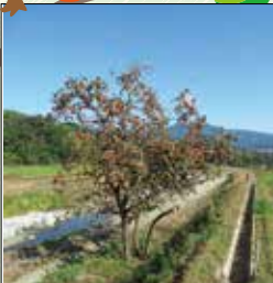
1本の柿の木 川のほとりにボツンと1本可愛らしく立っている柿の木。風景のアクセントとして、地元住民やハイカーに親しまれています。