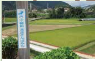
道標 コースに点在しており、ウォーキングをする際の目印になります。