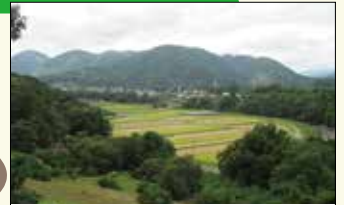
3 眺めのよい坂 運動公園を過ぎて、下り坂にさしかかると、急に開けた展望が広がります。コースの全貌が見渡せます。