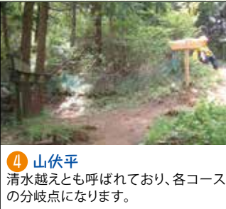
4 山伏平 清水越えとも呼ばれており、各コースの分岐点になります。