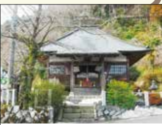
スタート地点の地藏堂