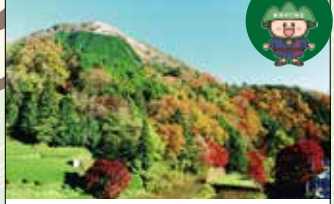
5 矢倉岳 お椀をふせたような特徴的な山容をしており、足柄平野から足柄山地の山々を眺めると、ひととき目立ちます。初心者や家族向けの山として人気があります。

ジオサイトって？ 箱根火山を中心とした地域の自然や歴史、文化、食などを大地とのつながりで楽しむ「箱根ジオパーク」の見どころです。