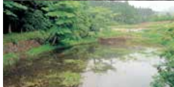
「舟原ため池」1658～60年に灌漑用として築造