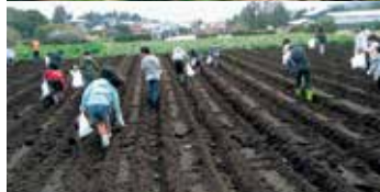
じゃがいも植え付け、久野小「学校農園」