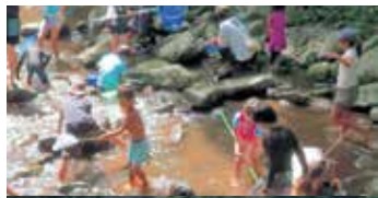
生き物観察、イベント「野遊び探検・夏の巻」

みかんやお茶の栽培など農林業も盛んな地域で、美しい森林や溪流を保全する地域の人たちの活動も活発な、子育てがしやすい環境です。地のものを紹介する農業体験や、豊かな自然に触れる“絆”イベントなども開催。自然とともに生きる地元の人々との心温まる交流こそが、久野の一番の魅力でもあります。