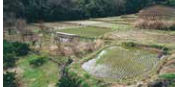
美しい棚田「欠ノ上田んぼ」