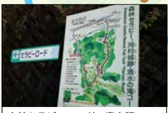
森林セラピーロードの案内版

山北町健康福祉センター さくらの湯 山北駅に隣接する便利な場所にある入浴施設。炭酸カルシウムが湯にとけ込んでいます。打たせ湯・圧注浴・サウナなどもあり、美肌づくりやリフレッシュなどに。 【住】足柄上郡山北町山北1971-2 【電】0465-75-0819 【営】11:00～21:00 【入】一般(高校生以上)500円(2時間)、子ども・障がい者200円(2時間) ※2時間以上滞在する場合は、1時間あたり一般(高校生以上)100円、子ども・障がい者50円 【休】木ほか 【HP】 http://www.town.yamakita.kanagawa.jp