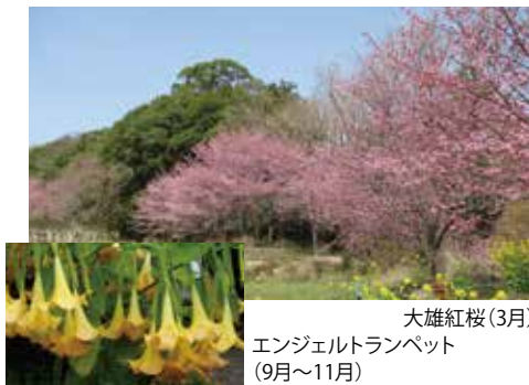
大雄紅桜(3月) エンジェルトランペット (9月～11月)

「ご当地」桜の大雄紅桜をはじめ、季節ごとに美しい花の姿を楽しめます。背景に広がる里山の絵になる風景。カメラを持って歩きたい！