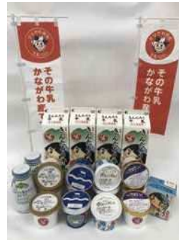
かながわ県産牛乳100%認証制度 認証済み製品