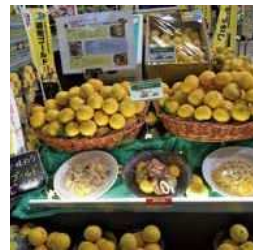
かながわブランドフェア