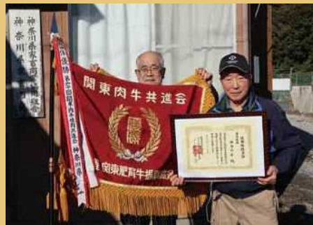
関東肉牛枝肉共進会で団体優勝した優勝旗が生産者へ授与された。

2020年は新型コロナウイルスの感染拡大による飲食店の営業自粛等の影響で、牛肉など高級食材の需要が落ち込み、肉用牛生産者の経営を直撃しました。そこで、学校の給食に県産ブランド牛等を提供し生産者を支援する事業を行いました。多くの学校が参加してくれたおかげで、県内小中学校の児童・生徒の約半数にあたる30万人の子ども達に美味しい県産ブランド牛等を届けることができました。