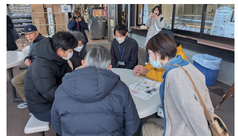
Going for a walk with the map