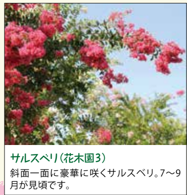
サルスベリ(花木園3) 斜面一面に豪華に咲くサルスベリ。7～9月が見頃です。