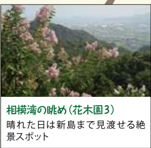
相模湾の眺め(花木園3) 晴れた日は新島まで見渡せる絶景スポット