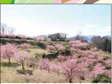
早咲き桜(花木園1) 2月下旬～3月中旬が見ごろ。3月初旬ごろには、毎年「四季の里 里山花まつり」が開催され、にぎわいます。