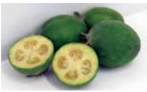
【詳しく知りたい方は】 「大井スイーツ」で検索 (大井町HP)

「フェイジョア」は、南米原産で見た目は梅、味と香りはパイナップルに似ているフルーツ。地元ではかつてみかんに次ぐ生産量を期待されましたが、思うように人気が出ませんでした。そんなフェイジョアに目を付けたのが、町内のシェフや菓子職人。フェイジョアを使ったケーキやまんじゅうなどを次々に開発すると大好評に。新しいご当地スイーツを、ぜひ味わって。