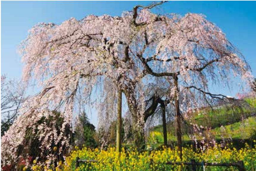
「寄五大しだれ桜」のひとつ(土佐原のしだれ桜)