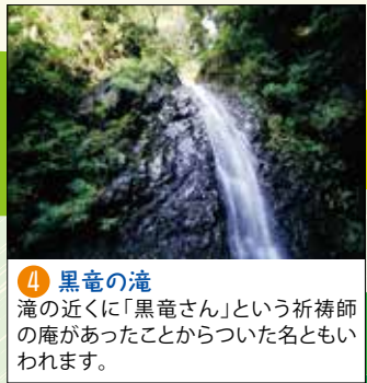
④ 黒竜の滝 滝の近くに「黒竜さん」という折禰師の庵があったことからついた名ともいわれます。