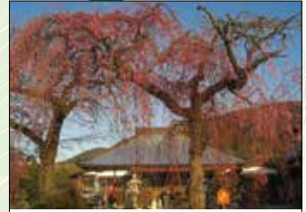
② 白泉寺しだれ桜 樹齢120年ともいわれ、4月上旬の花の時期には多くの見物客が訪れます。