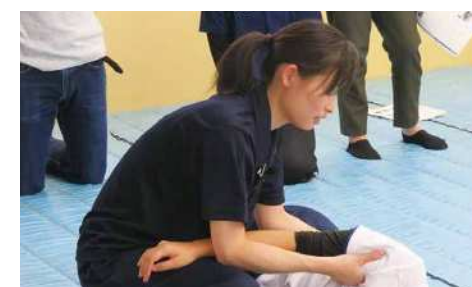
実習・ハンズオン（脊髄損傷のリハビリテーションより）