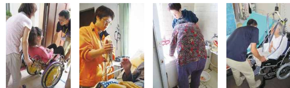
介助指導 コミュニケーション支援 ADL動作指導 福祉用具

相談内容に応じて理学療法士・作業療法士・リハエンジニア・ソーシャルワーカーなど 専門スタッフが対応いたします。