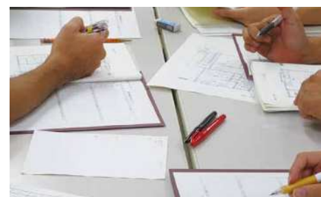
グループワーク（住宅改造改修セミナーより）