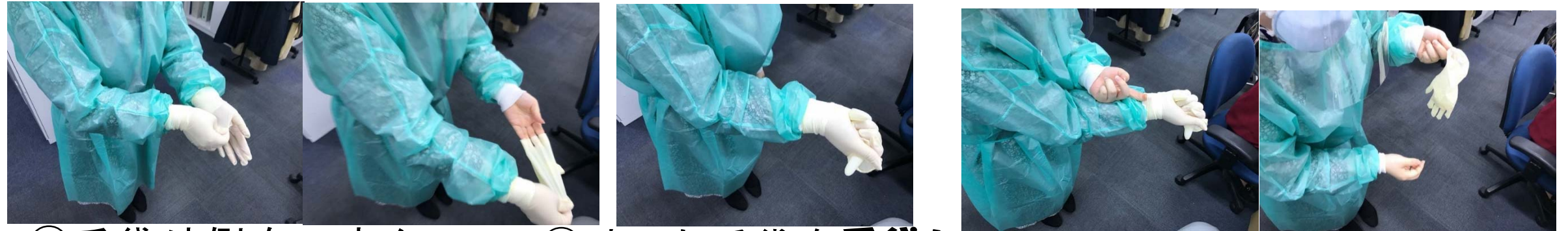
①手袋外側をつまんで手袋を外す