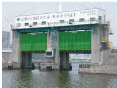
東京港海岸(江東地区)【東京都】