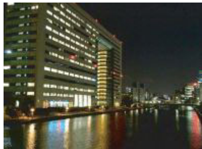
東京港海岸(港地区)【東京都】