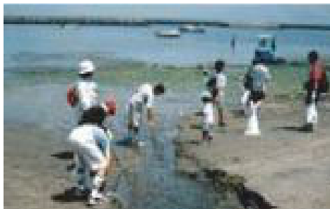
東京湾クリーンアップ大作戦