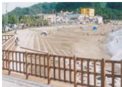
勝山漁港海岸【千葉県】

気象や地形、背後地の特性に応じて、防護・環境・利用の整合を図り、適切な海岸保全施設の整備を計画的に実施していきます。また、実施にあたっては、住民の方々や、区市町村などと情報や意見交換を行い、連携・協力してよりよい海岸づくりを行っていきます。