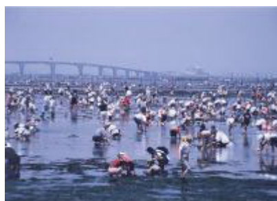
木更津海岸【千葉県】

気象や地形、背後地の特性に応じて、防護・環境・利用の整合を図り、適切な海岸保全施設の整備を計画的に実施していきます。また、実施にあたっては、住民の方々や、区市町村などと情報や意見交換を行い、連携・協力してよりよい海岸づくりを行っていきます。