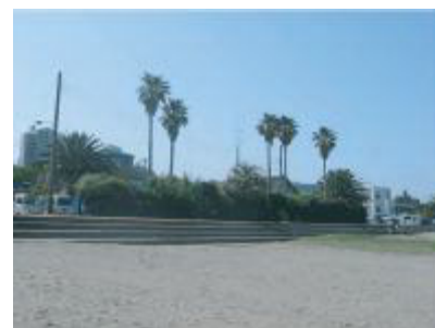
三浦海岸【神奈川県】