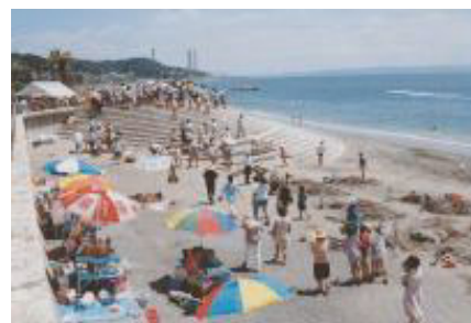
北下浦漁港海岸【神奈川県】