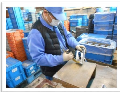
協力：株式会社小高製作所

特別支援学校では、職場で必要な作業能力や態度など、働くための基礎・基本となる力を身に付けるために、作業学習や校内での実習などに取り組んでいます。また、職場での実習については、多くの事業所等の皆様にご協力をいただきながら進めております。