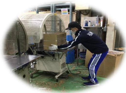
協力：ニッパ株式会社