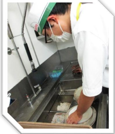
協力：株式会社サイゼリヤ