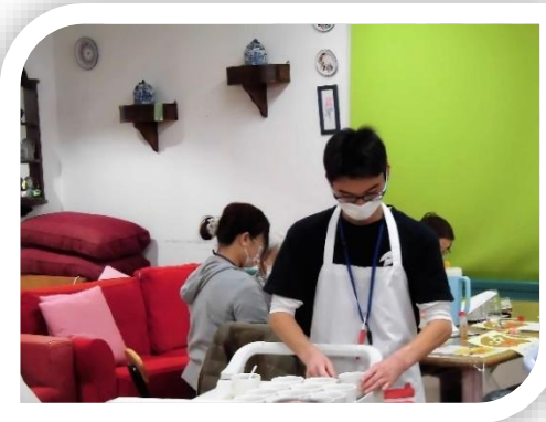
協力：株式会社伸こう福祉会 特別養護老人ホーム クロスハート栄・横浜