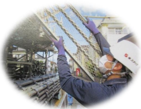
協力：株式会社スタック