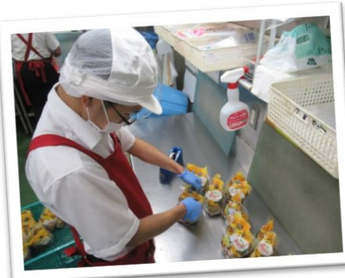
協力：オーケー株式会社