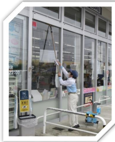
協力：株式会社クリエイトビギン