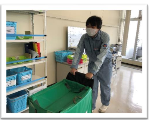
協力：株式会社小松製作所