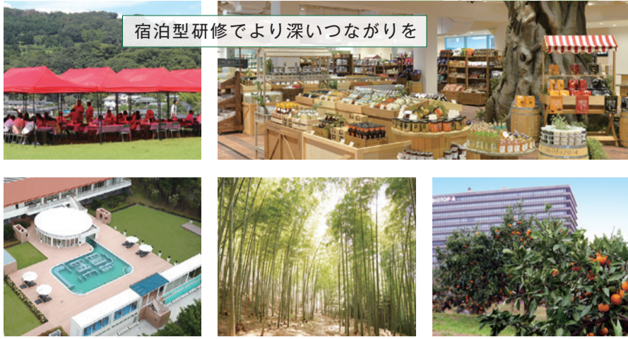
宿泊型研修でより深いつながり