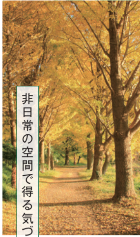
非日常の空間で得る気づき