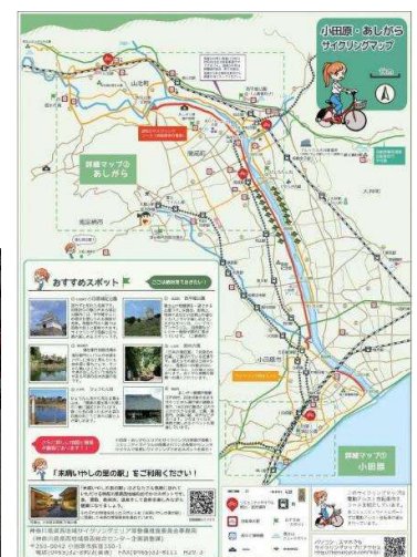
サイクリングマップ