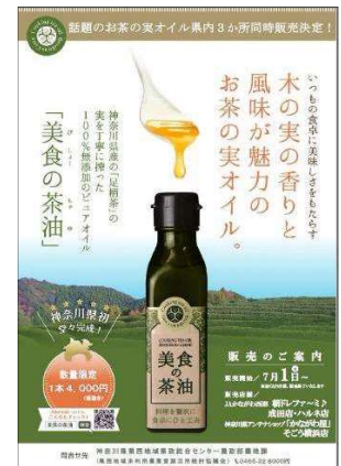
ティーオイルの販売告知

湘南ゴールドや茶実の「未病改善」につながる効果・効能の検証を行うとともに、これらの農産物を活用した商品を開発。