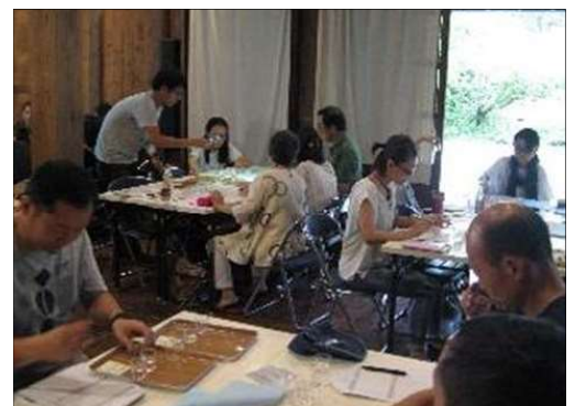
東京農大の学生と地域住民が 発酵を活かした特産物を試行

大学の知見と若者(学生)の視点を活かした、県西地域と連携する未病改善事業を支援。(H28:3事業、H29:6事業、H30:4事業、R1:5事業)