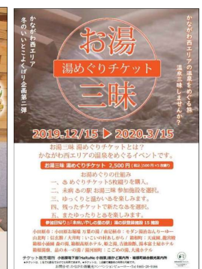
湯めぐりチケット