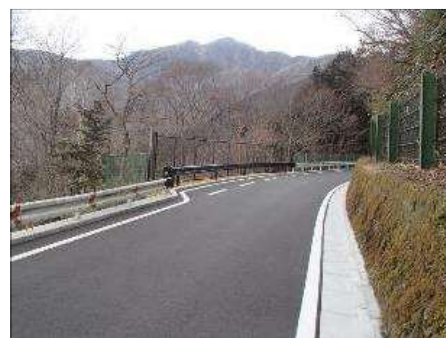
南足柄市と箱根町を 連絡する道路の整備

県道731号(矢倉沢仙石原)[南足柄市と箱根町を連絡する道路]及び広域農道小田原湯河原線等の整備を進め、地域交通ネットワークの形成を推進。 (南足柄市と箱根町を連絡する道路: 今年の台風19号による法面崩落等の影響により、工程を精査中。広域農道小田原湯河原線: 令和6年度完成予定)