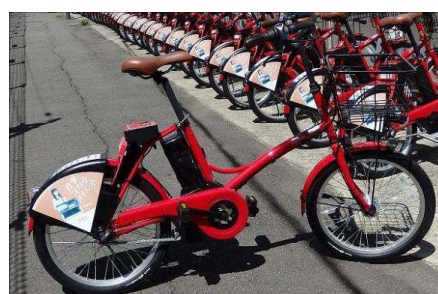
電動アシストのコミュニティサイクル

コミュニティサイクルの設置場所(サイクルポート)を県西地域内に複数設置し、また、自転車での来訪者をサポートする施設を「自転車の駅」とするなど、自転車による県西地域の回遊を促進。 (サイクルポート:13か所、自転車の駅:55か所)