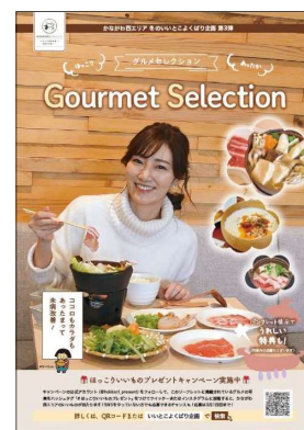
グルメセレクション

未病バレー「ビオトピア」や「未病いやしの里の駅」等、県西地域の未病改善拠点を複数回遊する企画を実施し、誘客を促進。 (H29:6企画、H30:3企画、R1:3企画)