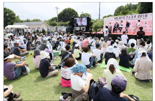
ME-BYOフェスタ2018 (会場:未病バレー「ビオトピア」)

未病バレー「ビオトピア」でのイベント主催や、県西地域の各種イベントへの出展により、未病改善の普及促進とともに県西地域への誘客を促進。(H28:主催1、出展19、H29:主催0、出展19、H30:主催1、出展20、R1:主催2(台風やコロナウイルス対応で中止)、出展17)