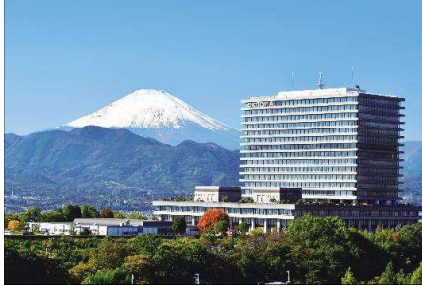
未病バレー「ビオトピア」

県西地域が「未病の戦略的エリア」であることをアピールする拠点として、未病バレー「ビオトピア」(運営主体:株式会社ブルックスホールディングス)がオープン。県運営の体験型施設「me-byoエクスプラザ」も開設。(ともにH30.4オープン)