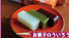
お菓子のういろう