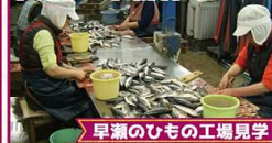
早瀬のひもの工場見学