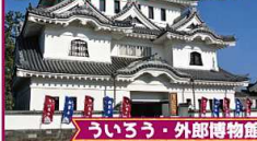
ういろう・外郎博物館