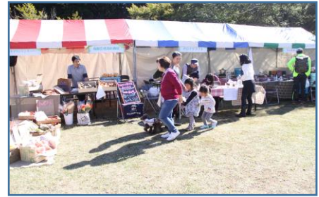
はこじょマルシェ

内容：フォレストキッチン体験、アロマやクラフトのワークショップ、県西地域の農産物販売、未病PRブース等