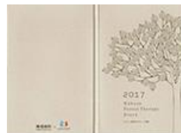
はこじょ森林セラピー手帳