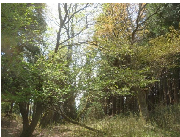
新緑のマメザクラ