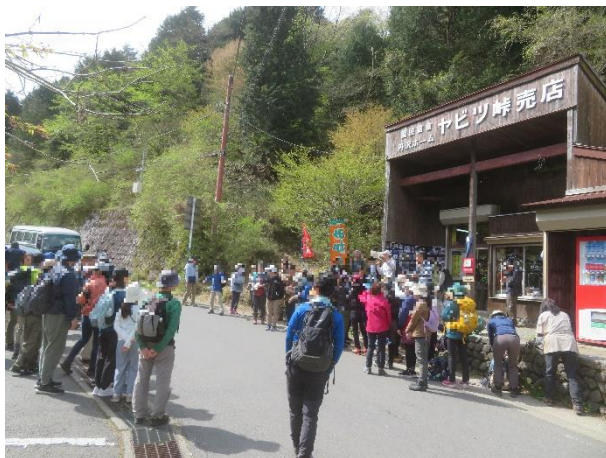
集合場所（ヤビツ峠）