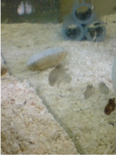
写真1 生まれたてのイイダコ