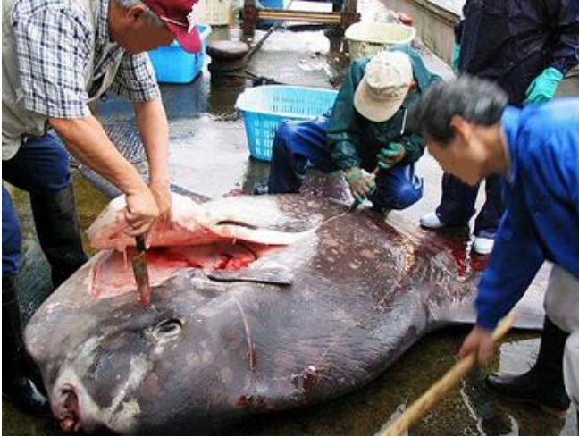
解体されるマンボウ