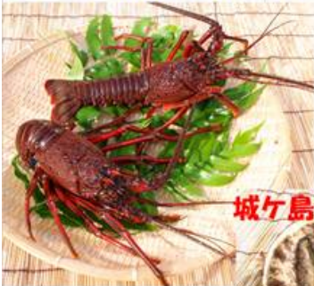
城ヶ島ブランドの貝類

島全体が天然の磯根に囲まれた城ヶ島は海藻類も豊富でそれを餌とする魚貝類にも恵まれています。特に貝類は、夏場の潜水、冬場のみづき漁で一年を通じて多く水揚げされ、城ヶ島の荒磯が育んだ逸品「城ヶ島ブランド」として有名です。その他にも、刺網で水揚げされる、イセエビ、カワハギ、カサゴ等の活魚も、外洋に面した潮流にもまれて身が締まって美味！城ヶ島の地ダコ、活イカ、ナマコ、ワカメ、天草、アカモク等の海藻類など。漁師の朝どれ、獲れ立てピチピチの活きの良さで、美味しい城ヶ島の旬の食材が勢揃い！城ヶ島観光も兼ねていらして下さいね。