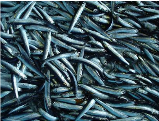
写真2：カタクチイワシ