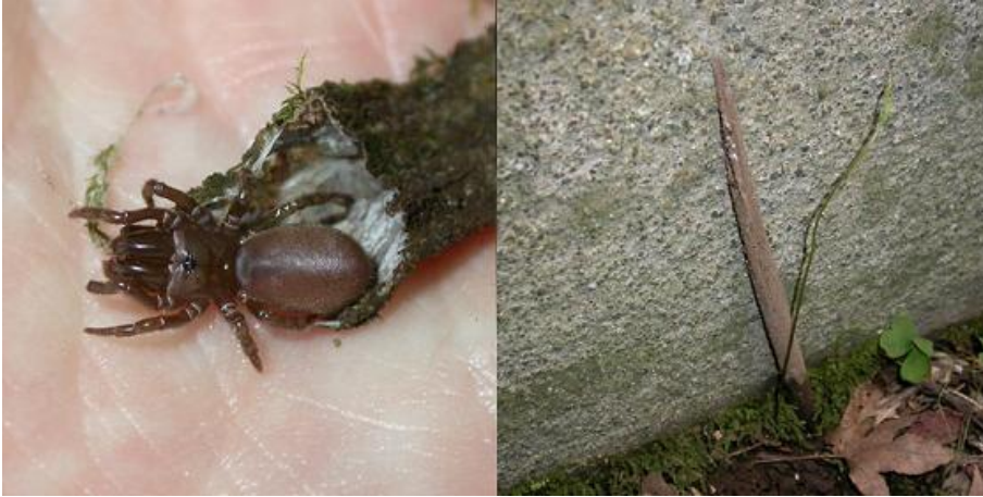
写真4：ジグモ♀（左）とその住居（右）