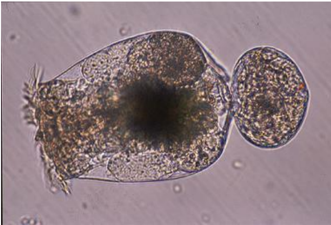
シオミズツボワムシ