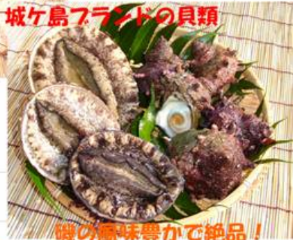
磯の風味豊かで絶品！