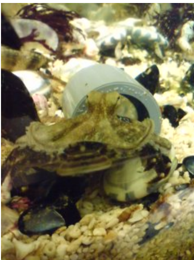
写真3 カニを捕まえたイイダコ（2ヶ月後）