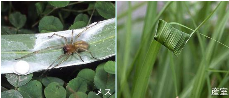
写真3：カバキコマチグモ♀（左）とススキの葉を巻いて作った産室（右）