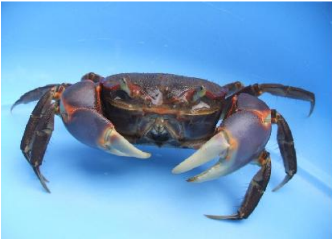
写真2 立派なはさみを持ち泰然自若としたハマガニ