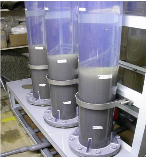
発眼卵への標識付け