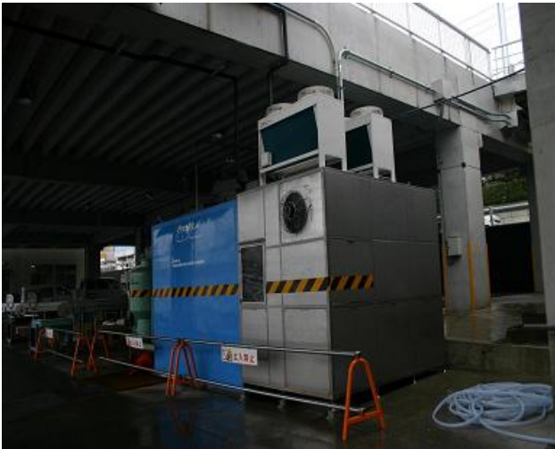
写真1：殺菌冷海水製造貯蔵装置