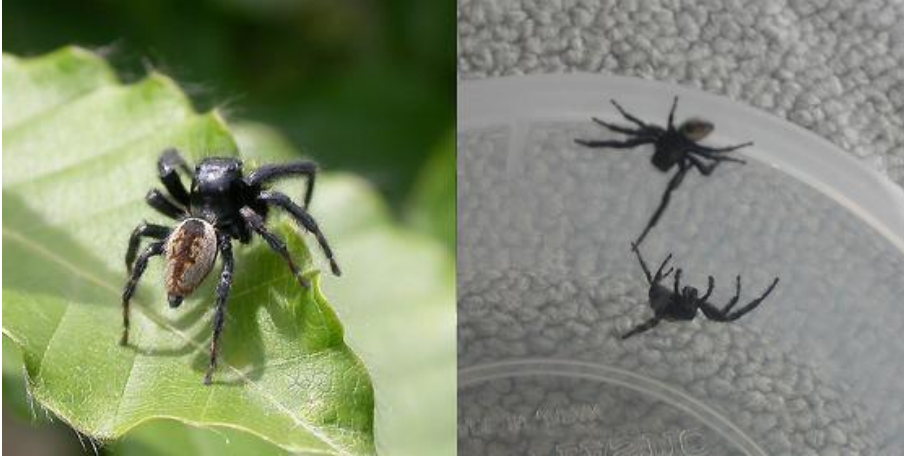
写真2：ネコハエトリ♂（左）とオス同士が威嚇している様子（右）