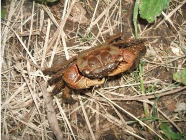
写真1 県下河川の河口域には最も多いクロベンケイガニ