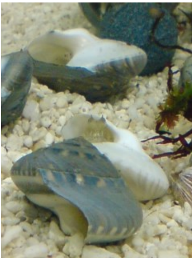
写真2 ダンバイキサゴの貝殻に忍ぶイイダコ（2週間後）