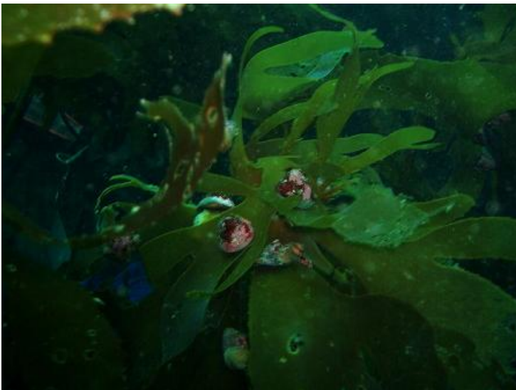
写真3 アラメを食べるバテイラ