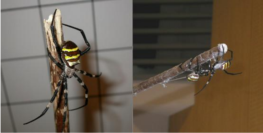
写真1：コガネグモ♀（左）と鹿児島県加治木町の「くも合戦大会」の様子（右）

◎三浦半島での地方名：エドグモ（三浦市初声町三戸）、カネグモ（三浦市南下浦町松輪）