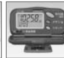
HJ-106 脂肪燃焼量表示付き