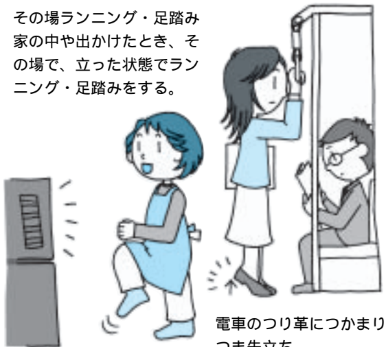
電車のつり革につかまり つま先立ち

その場ランニング・足踏み 家の中や出かけたとき、そ の場で、立った状態でラン ニング・足踏みをする。