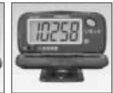
HJ-005 見やすい大型液晶表示