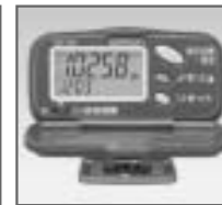
HJ-107 7日間のメモリ付き