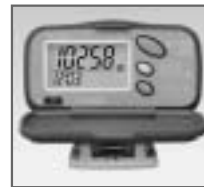
HJ-108 夜間のウォーキングに 便利なバックライト付

生活習慣病予防や、ダイエットのためのウォーキング。毎日楽しく、無理なく続けるために、「あったらいいな」の機能を揃えたカンタン操作の歩数計が、皆様の健康づくりをサポートします。