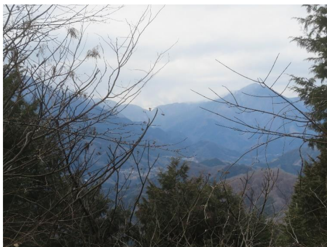
丹沢方面の展望（左：中腹から、右：山頂から）