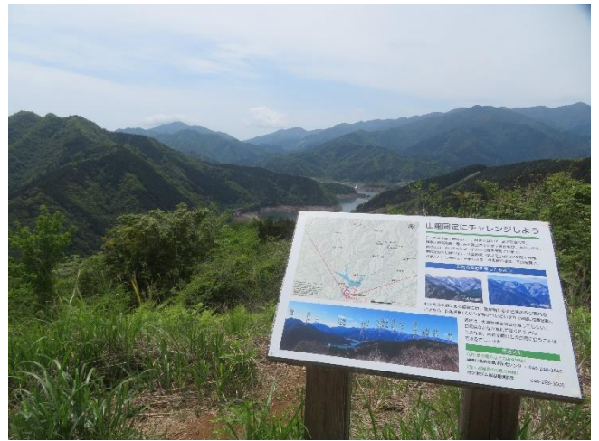
南山山頂の新しくなった案内看板（左：2024年9月 右：2026年4月）