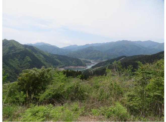
南山から宮ヶ瀬湖方面の展望