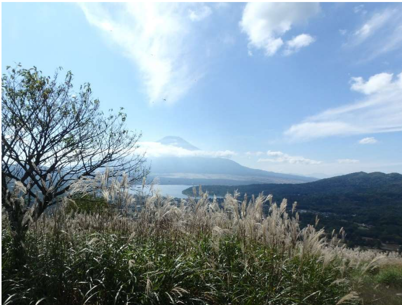
高指山山頂からの眺め

●高指山山頂や富士岬平では、ススキが見ごろでした。そういえば十五夜の前日でした。