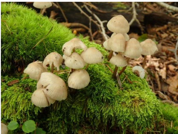
コケに生えたキノコの仲間