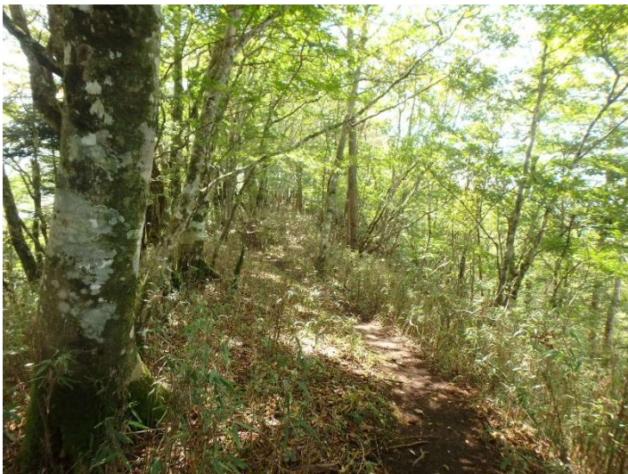
コースの大半を占めるブナ林

●9月は日照時間が少ない日がほとんどだったので、木漏れ日の中の山歩きが爽やかでした。