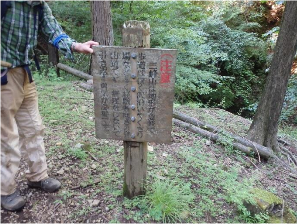
(写真3) 分岐近くの注意看板

● 沢沿いはクサリ場が多く、濡れると滑りやすい岩の上を歩きます。また、尾根では、細い尾根沿いや急峻な斜面を歩くため注意が必要です。(写真3、4、5)