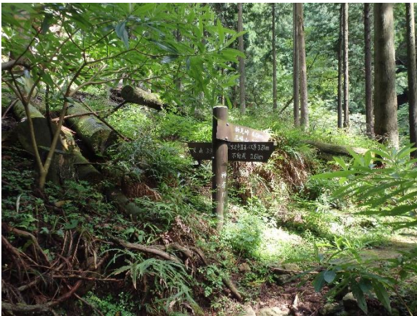
（写真2）分岐にある指導標識