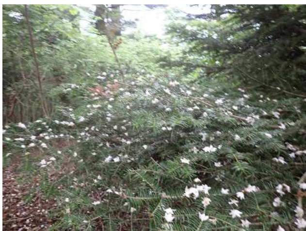
モミに咲いているようなマルバウツギの落花