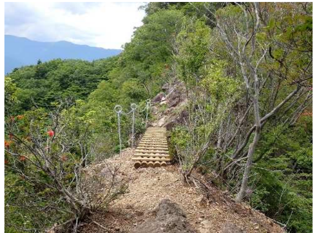
新しくできた木道