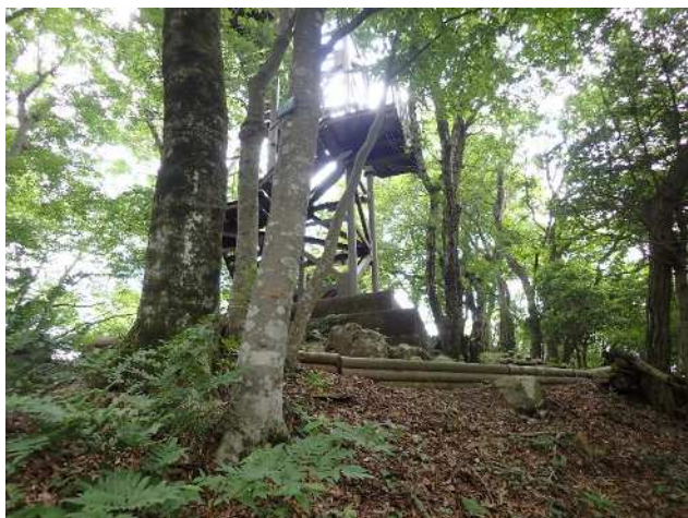
仏果山展望塔付近に登山者はいませんでした

●山頂周辺の気温は 21℃。蒸し暑い平地に比べ風が抜けると涼しさを感じるほどでしたが、水分補給はずいぶん増えました。熱中症予防の備えが必要な季節になってきました。