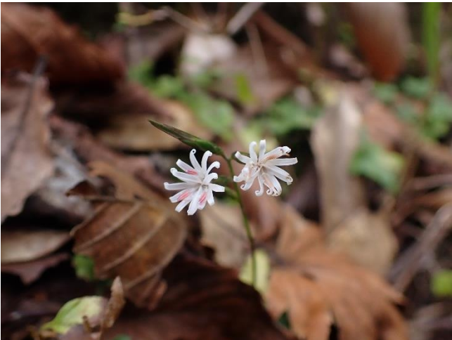
キッコウハグマ 1センチ程の小さくも可憐な花です。