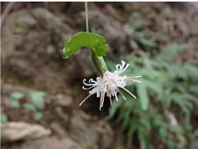
コウヤボウキ 日本では、キク科の小低木はコウヤボウキの仲間だけ。