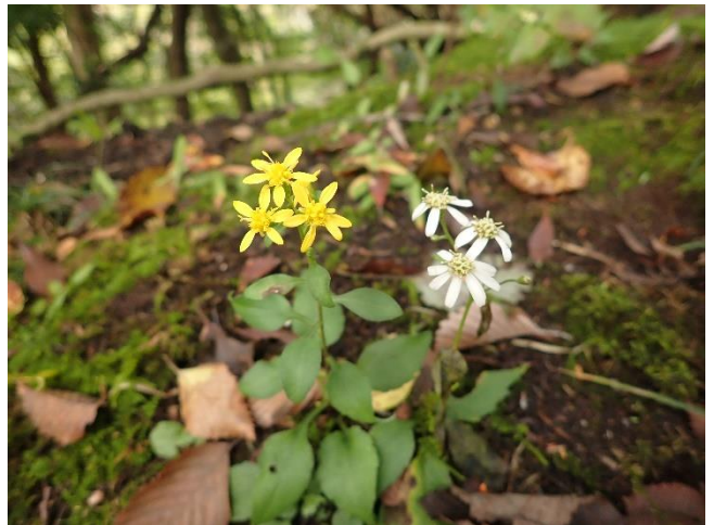
アキノキリンソウ（左）とシロヨメナ（右） 仲良く並んで咲いていました。