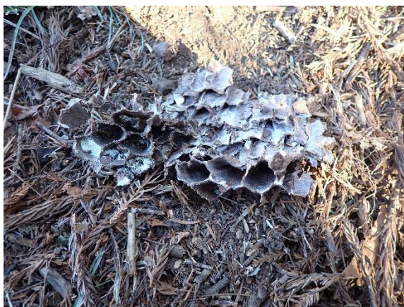
掘り起こされたハチの巣