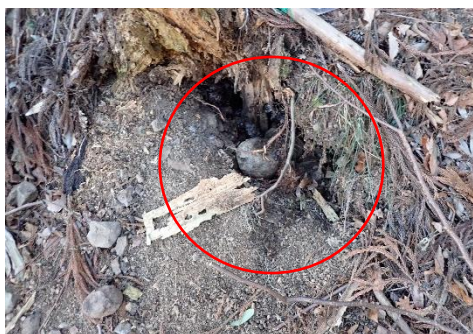
ハチの巣を掘り起こした跡