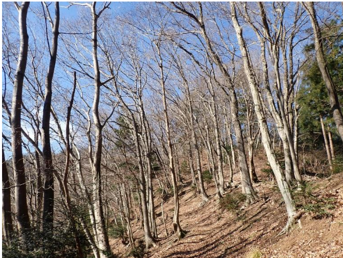
雑木林の中のなだらかな登山道

一方、登山道に落ち葉が積もり足元の状況がわかりにくい箇所があったり、山の斜面に沿ってつくられたトラバース道は道幅が狭く、滑落しないよう注意が必要です。