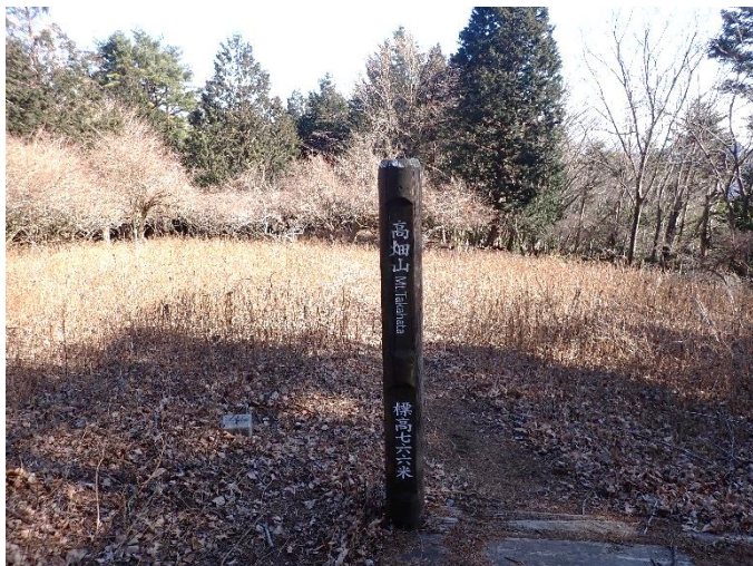
高畑山山頂の様子