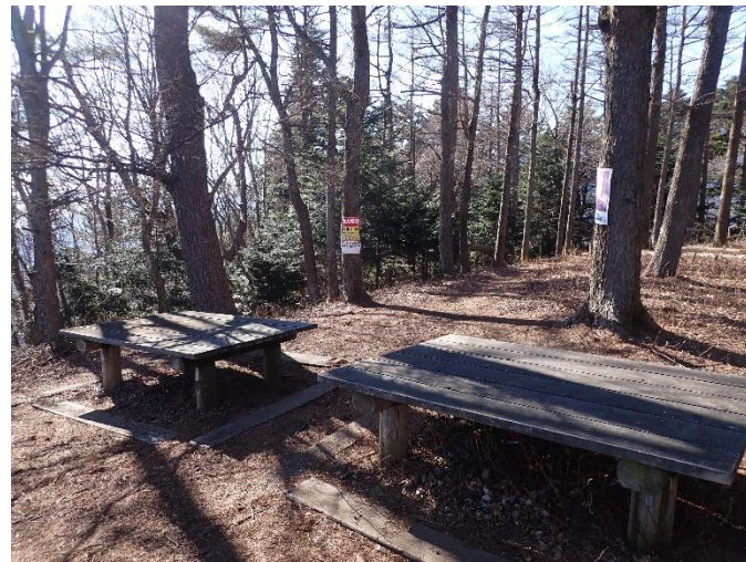
野外卓が2基あります