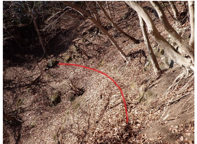
赤線上が登山道、赤線下は急な斜面